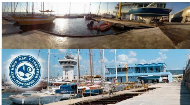
Facebook: Yacht Club Port Varna